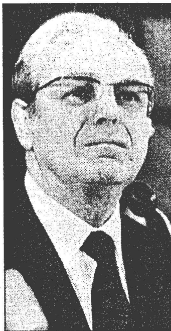
Javier Pérez de Cuéllar.

El primer ministro de Malasia, Mahathir Mohamad, destacó también la necesidad de la colaboración internacional y la falta de recursos económicos de los Estados para combatir las grandes cantidades de dinero que mueven los narcotraficantes.