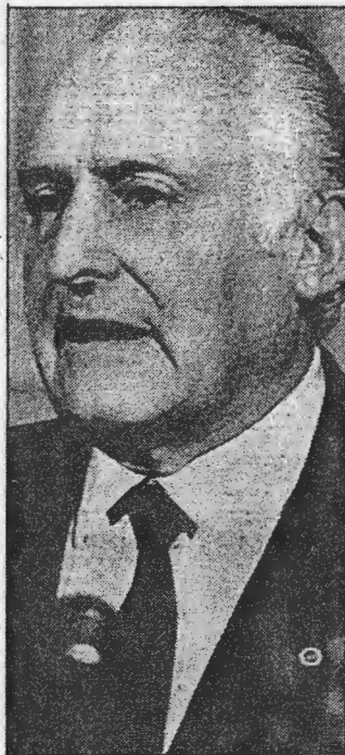
Oscar Luigi Scalfaro.

Otros países, calificados de astutos por algunos observadores occidentales, destinan gran cantidad de fondos para los mencionados planes de sustitución de cultivos siempre que ellos sean los que lleven a cabo los proyectos o mediante intercambios comerciales con los países a los que van destinados,