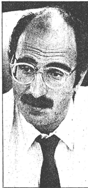
Julián García Vargas.

El ministro de Sanidad español explicó también que el Gobierno trata de desarrollar la acción preventiva en el marco de una política global de