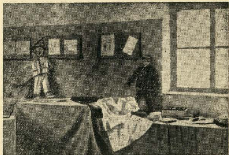
פון דער אויסשטעלונג, די שילער וואָס צייטונגען.