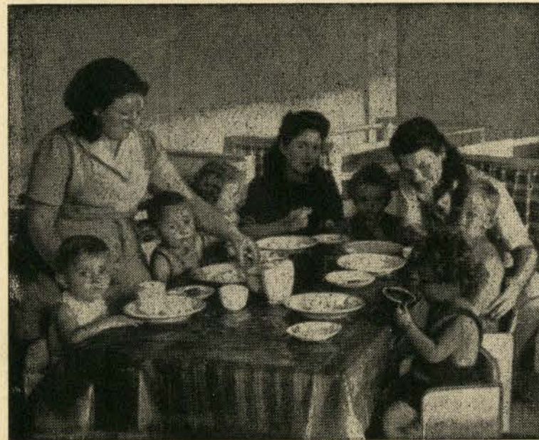
די קינדערלעך אין זייער עסטימער.