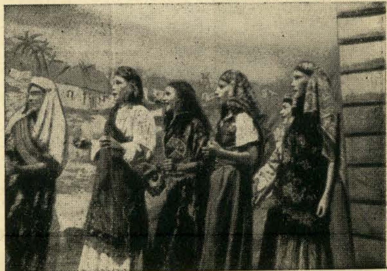
א סצענע פון „בת יפתח“.