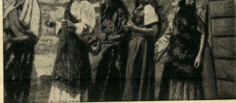
אַ סצענע פון „בית יפתח“.

נאָר אַעס קען זיין אז אין אַזעלכע שעהן ווען, טאמער וועלן נאך אַ שווערן אַרבעטס-טאג, אונטער פרייע, מיט גליקליכע רוי אַנגעזאַפּטע הימ-