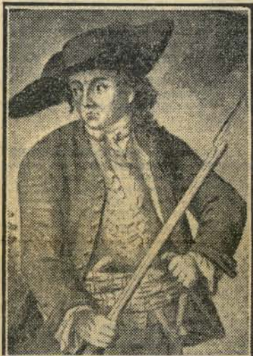
Portrait de Mandrin.

diens logés sous les toits où ils ont creusé des meurtrières, dirigent un feu d'enfer sur leurs assaillants.