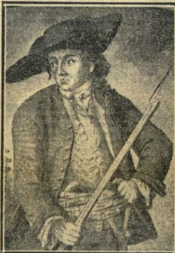
Portrait de Mandrin.

dièrs logés sous les toits où ils ont creusé des meurtrières, dirigent un feu d'enfer sur leurs assaillants.