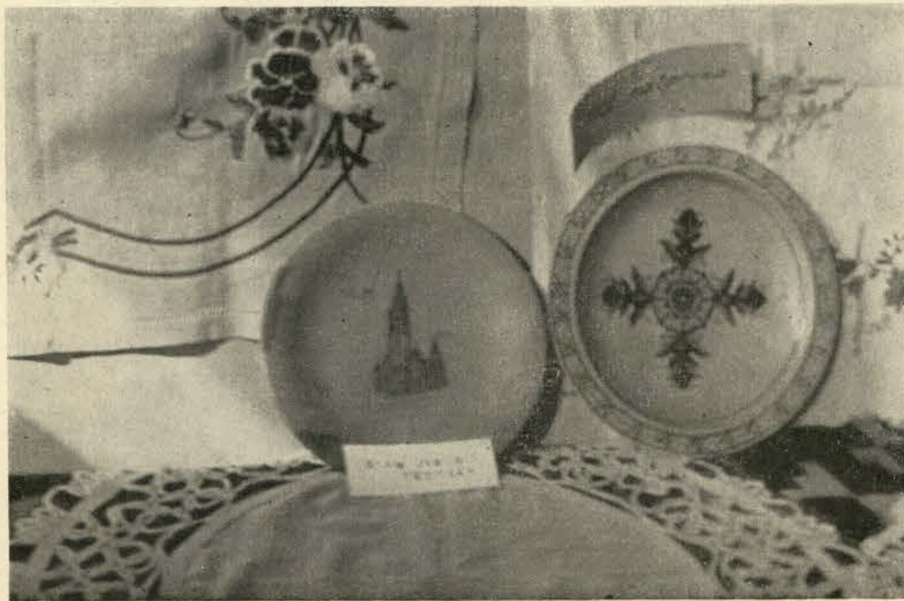
Umetnost nase brace na Frajmanu.

Posebno jos isticemo lepi sto i izlozbu stampe Jugoslovenskog Nacionalnog Komiteta — redakcije „Jugoslovenske Otadzbine“ u logoru i redakcije novina „Jugoslavija“ u vojnoj kasarni. Izlozene ilustracije po grupama privlacile su paznju posetioca izlozbe. Prvi deo