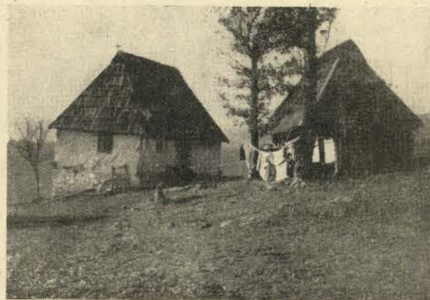
Jedna od preostalim kuca