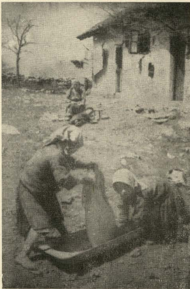
Njegova sirocad i dalje se bore....