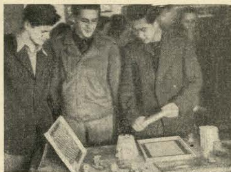
Razni momenti sa izlozbe