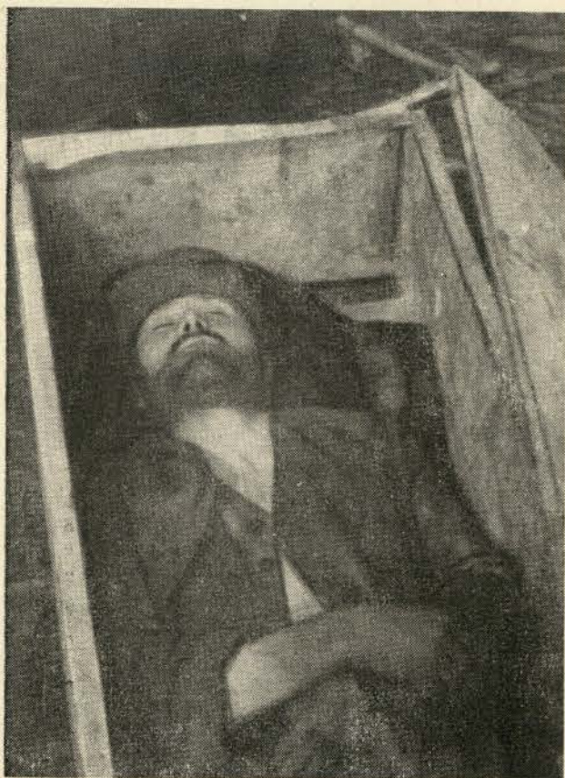
I ako je dobar roditelj mucenicki pao...