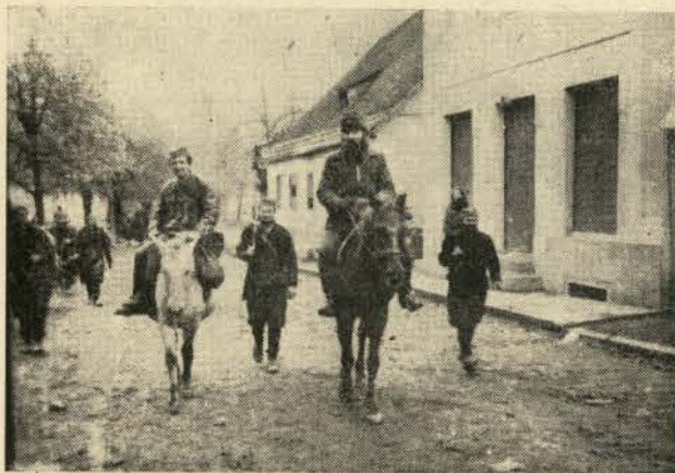
Kroz ulice Gorazde